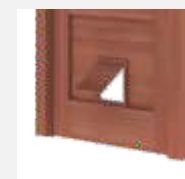
Kłapka dla kota

Wybierz spośród dostępnych funkcjonalności rozwiązania odpowiadające Twoim potrzebom.